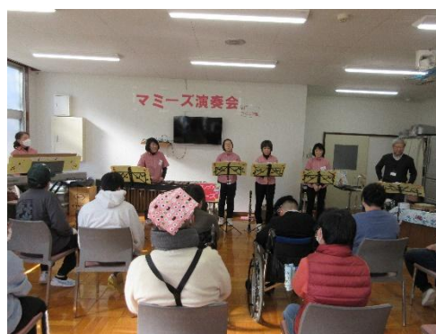
第3回社会参加研修 マミーズ演奏