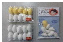
まゆ製品の袋詰め