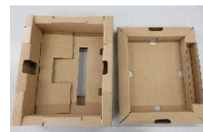
段ボールの組み立て