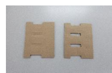
段ボールの型抜き