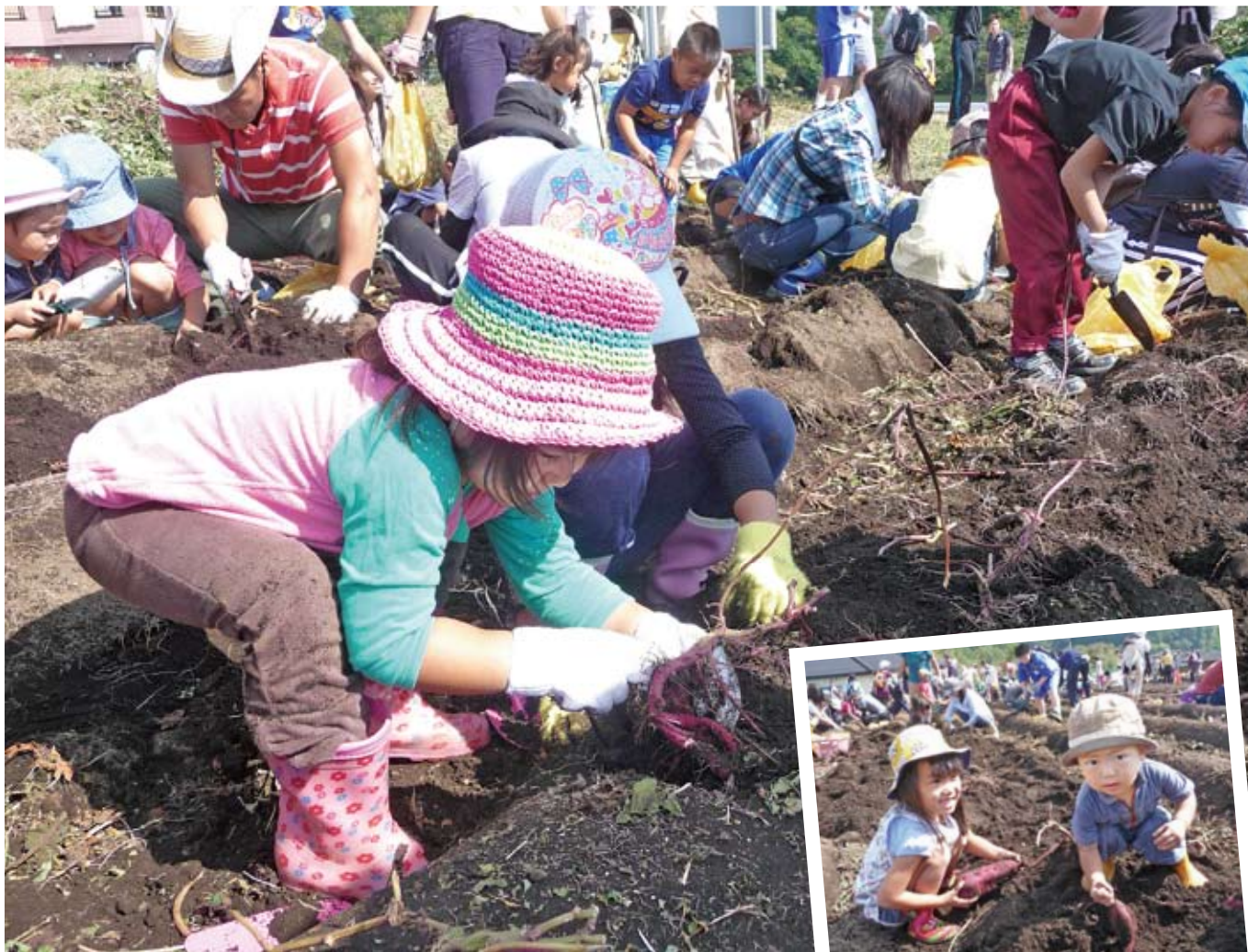
▲ サツマイモ掘りを楽しむ子ども

〈発行〉 社会福祉法人 富岡市社会福祉協議会 ( 富岡市富岡1439-1 ☎ 70-2232 ) ( あい愛プラザ1階 FAX 62-6223 )